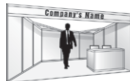
* Ukuran stand minimal (4x3)m 2 : 12m 2 (Harga belum termasuk pajak)

Stand Standar (3m x 4m) Rp. 3.000.000,-/m 2